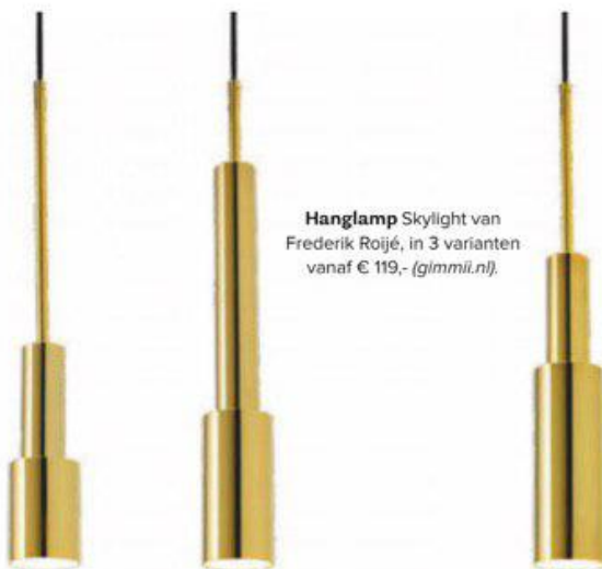
Hanglamp Skylight van Frederik Roijé, in 3 varianten vanaf € 119,- ( gimmil.nl ).