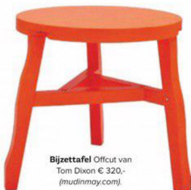
Bijzettafel Offcut van Tom Dixon € 320,- ( mudinmay.com ).