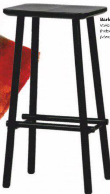
Barkruk Butt van vtwonen, 76x40x30 cm (hxbxd) € 129,- ( vtwonen.nl ).