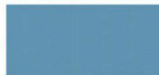
Blauw Blue Verditer 104