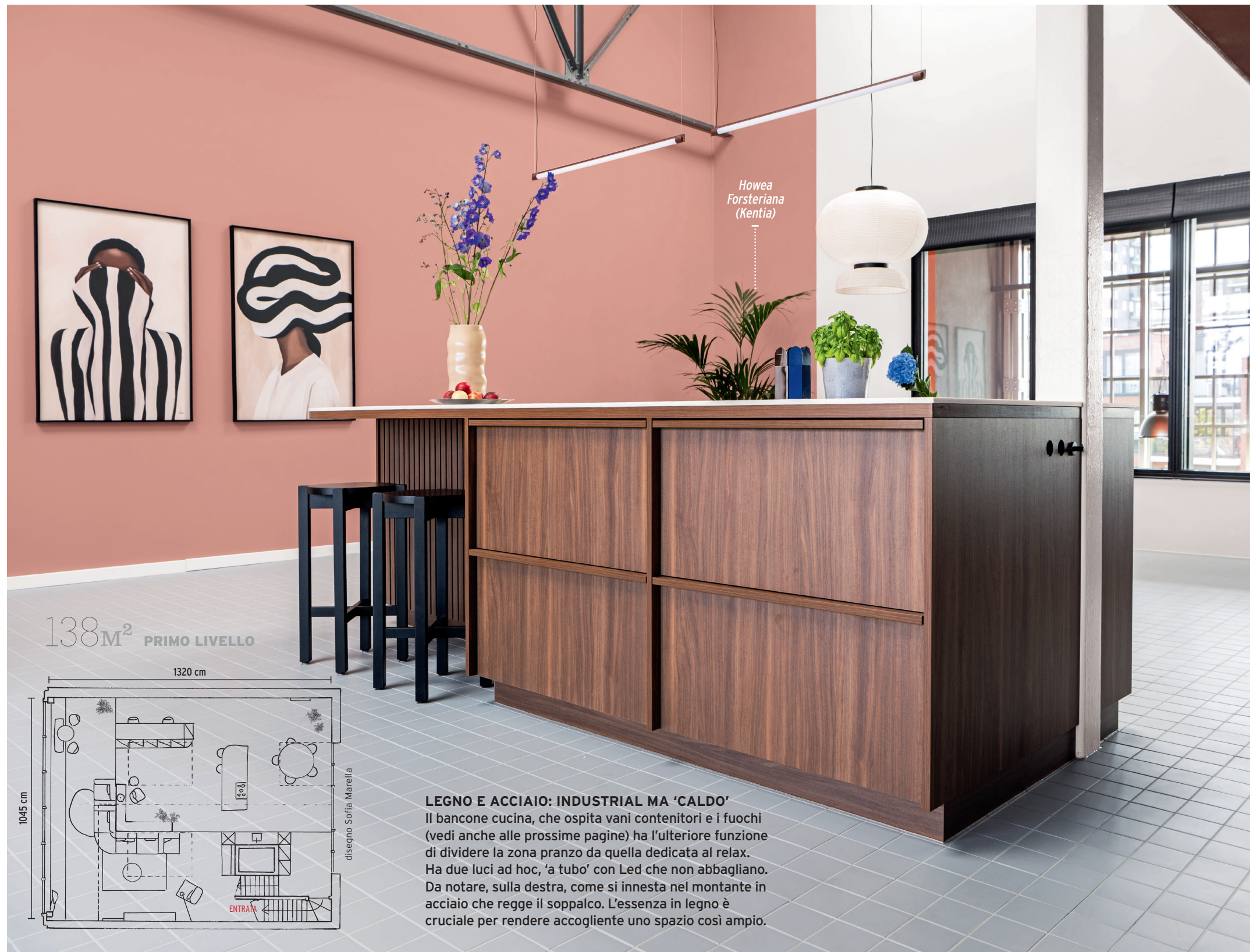
Howea Forsteriana (Kentia)